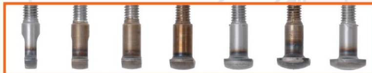
4,5mm 6mm 7,5mm 9mm 10,5mm 12mm 13,5 mm Breedte voegen

De trend van nu. De doorgestreken (verdiepte) voeg is homogener, sterker en vooral fraaier. Geen wonder dat architecten steeds vaker grijpen naar deze techniek boven conventioneel voegen. Met de Easypointer® valt er bovendien tijdswinst te behalen. In één bewerking de voeg uitkrabben én doorstreiken.