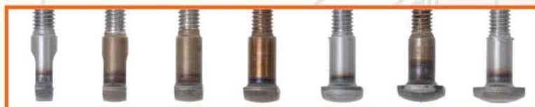
4,5mm 6mm 7,5mm 9mm 10,5mm 12mm 13,5mm Breedte voegen

De trend van nu. De doorgestreken (verdiepte) voeg is homogener, sterker en vooral fraaier. Geen wonder dat architecten steeds vaker grijpen naar deze techniek boven conventioneel voegen. Met de Easypointer® valt er bovendien tijdswinst te behalen. In één bewerking de voeg uitkrabben én doorstrijken .